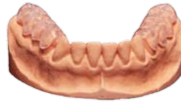
Aufbisschiene in Position